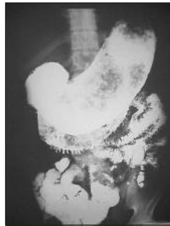
Figura 1.- Serie gastroduodenal mostrando defecto de relleno.

La endoscopia gástrica mostró concreción de cabellos y moco que ocupaba casi todo el lumen del estómago.