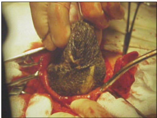
Figura 2.- Gastrotomía: El tricobezoar ocupa toda la cavidad gástrica.

En la evolución, la paciente cursó con cuadro de oclusión intestinal. Fue sometida a una laparotomía con gastrotomía (Figura 2) y extracción de un cuerpo extraño de color negro brillante, fétido, de 30 x 15 x 10 cm, que pesó 1800 g (Figuras 3 y 4).