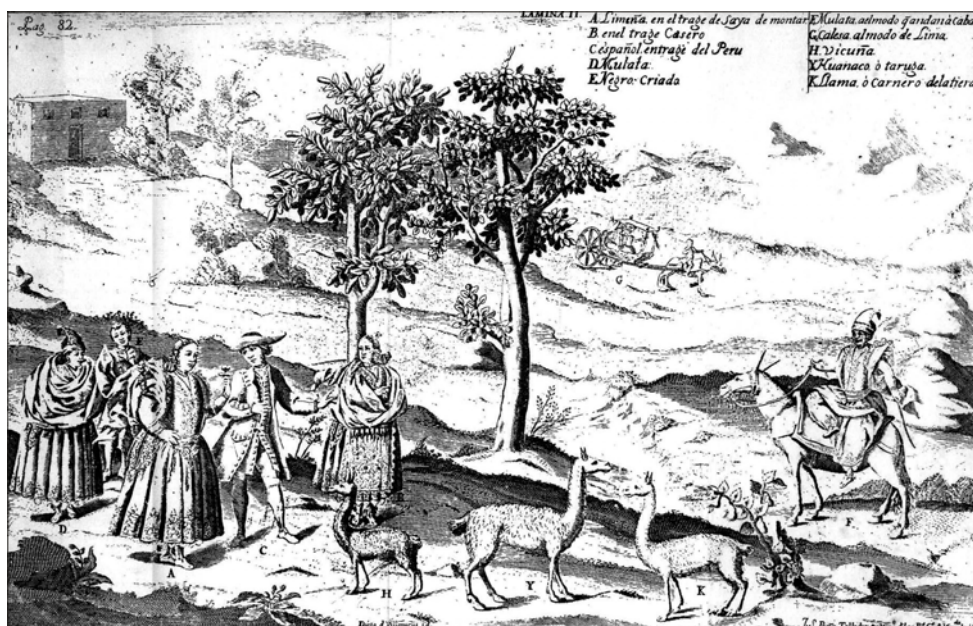
Figura 2. Antonio de Ulloa y Jorge Juan. Ilustración: Descripción de los habitantes del Perú. Relación histórica del viaje a la América Meridional, hecho de orden de S. Mag. para medir algunos grados de meridiano terrestre, y venir por ellos en conocimiento de la verdadera figura, y magnitud de la tierra, con otras varias observaciones astronómicas, y físicas (Madrid 1748, tomo III, página 82). El grabado, con las leyendas propias de los geógrafos de la ilustración muestra un orden natural del territorio, parte de ello, lo constituyen las castas que pueblan el Perú. Las descripciones de Antonio de Ulloa y Jorge Juan fueron muy sugestivas para los ilustrados peruanos. En su discurso 'Decadencia y Restauración del Perú', Unanue cita en varias oportunidades a Ulloa, de quien toma las vívidas imágenes de desolación y despoblamiento del país.

“Hoy el Perú parece decidido a seguir con fe y perseverancia el camino del progreso. Cuenta con elementos bastantes para alcanzar en el un puesto avanzado. A más de los recursos infinitos con que ha prodigado la naturaleza a nuestro suelo, poseemos las enseñanzas y la triste experiencia por la historia de casi un siglo de error y amargura. Es pues, ya tiempo de aprovechar tan ricos dones, de convertir en reales las riquezas que hasta hoy permanecen en estado potencial; para ello no nos es necesario inventar ni ideas, ni principios, ni métodos ni procedimientos, basta que querramos repetir lo que han hecho ya las demás naciones para llegar a la altura en que se encuentran...” (27)