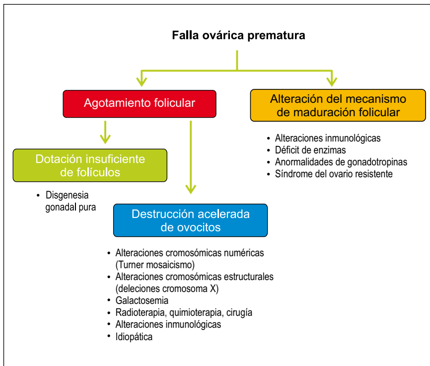
Figura 1. Mecanismos involucrados en la falla ovárica prematura.

Entre las alteraciones estructurales del brazo corto del cromosoma X, tenemos 45,XXp, 46,XXp, entre otros. Pueden cursar con fenotipo del síndrome de Turner y talla baja; 25% de los casos muestra aspecto y funciones normales, ya que las alteraciones estructurales del brazo corto no suelen producir disfunción ovárica.