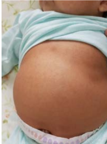
Figura 1. Exantema en tórax.

Niño de 2 meses, sin antecedentes de importancia, con un tiempo de enfermedad de 6 días, caracterizado por fiebre, aumento de volumen en región submaxilar derecha e irritabilidad. Cuatro días antes del ingreso, se agrega deposiciones líquidas con moco sin sangre (5 cámaras al día), rinorrea y tos. En el examen físico: temperatura de 37°C, piel pálida, eritema del área del pañal, se palpa tumoración en región submaxilar derecha de 2 cm aproximadamente con leve eritema en