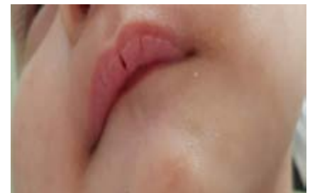
Figura 2. Fisuras en labios.

nos y pies +/+++; persiste irritable y febril. El día 6 control de hemoglobina 5,8 g/dL, hematocrito 18%, se realiza transfusión de paquete globular. El día 7 de hospitalización presenta micropapulas eritematosas en rostro, tórax y muslos (Figura 1), edema persiste en pies, eritema conjuntival en ojo derecho. El día 8 se realiza tomografía de cráneo de resultado normal y control de punción lumbar (leucocitos 11, mononucleares 100%, proteínas 122 y glucosa 32) y se solicita ecocardiograma. El día 9 persiste febril, se agrega descamación periungueal y fisuras en labios (Figura 2 y 3); por lo que se decide el paso de inmunoglobulina. El día 10 se realiza la ecocardiografía: dilatación de coronaria derecha 6 mm e izquierda 5 mm, dilatación leve de cavidades izquierdas, derrame pericárdico leve, cpk-mb 12U/L cpk-ck 13U/L. Luego del paso de inmunoglobulina endovenoso no volvió a presentar fiebre no rash, ni irritabilidad. 5 meses después se realizó una ecocardiografía control, encontrando la coronaria derecha 2,2 mm e izquierda 3 mm.