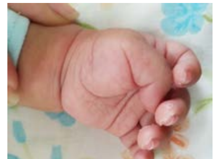
Figura 3. Descamación periungueal en manos.