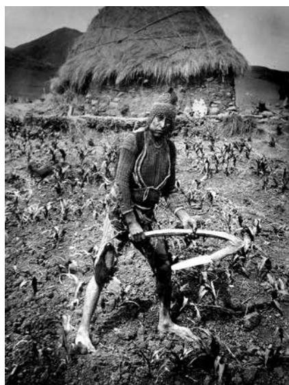
Figura 1. Campesino en labor agraria mascando coca, 1934.

Las hipótesis académicas sustentadas por Gutiérrez-Noriega y sus colaboradores en la década de los 40s sobre los efectos anoréxicos, toxicológicos y biosociales referidos a la cocaína, se efectuaron en un contexto de factores sociales, económicos, culturales y médicos negativos (1) . Sin embargo, en la década del 70