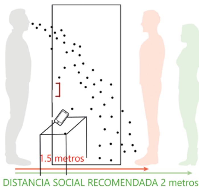
Figura 1. Gotas emitidas y su caída a corta distancia de acuerdo a Organización Mundial de la Salud. Una persona infectada al toser, estornudar o hablar, emite gotas cargadas de virus y contagia a las personas cercanas y los objetos donde caen estas gotas.

Fueron los estudios de la transmisión de la tuberculosis del siglo XX, los encargados de demostrar que la difusión aérea es la forma más importante de transmisión de esta enfermedad (6) . Un estudio llevado a cabo en nuestro país demostró que los pacientes VIH positivos con tuberculosis tuvieron una variación muy grande en la producción de partículas infecciosas, y solo algunos fueron altamente infecciosos (7) ; así, la superpropagación parece ser la forma usual de contagio de la tuberculosis (8) . Por otro lado, los pacientes con tuberculosis pulmonar eliminan en cada respiración un poco más del triple de gotas de diámetro < 5 \mu\text{m} que