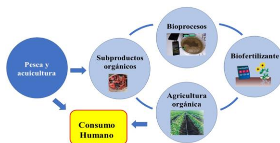
Figura 1. Procesamiento de subproductos de la pesca y acuicultura en economía circular.

La Figura 2 muestra los subproductos sólidos generados en el procesamiento de congelado de filetes de merluza y los porcentajes que representan según el compendio de biológico tecnológico de las principales especies comerciales del Perú (ITP-IMARPE, 1995).