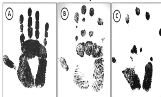
FIGURA 1. En el estudio se obtuvo pacientes con diversos grados de queiroartropatía: Grado 0: Todos los dedos son visibles, Grado A: No se visualiza las áreas interfalángicas del 4º y/o 5º dedos, Grado B: No se visualiza las áreas interfalángicas del 2º al 5º dedos, Grado C: Solamente se visualizan las puntas de los dedos.

En los hallazgos ecográficos (Figura 2), se pudo evaluar: el engrosamiento de las vainas de los tendones flexores (si la medida ecográfica fue >1mm) o no engrosamiento de las vainas de los tendones flexores (si la medida ecográfica fue < 1mm). Además se pudo identificar si el engrosamiento pertenecía a la vaina de los tendones flexores interfalángico distal o interfalángico proximal.