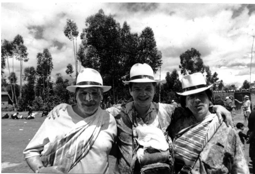
Trabajo de campo participativo en los carnavales de Jauja, 2006.

este tema es el que hoy atrae una gran atención en todo el mundo, e infinidad de países se encuentran ávidos de tratar de comprenderlo. Y Teófilo ha sabido estar a la altura de esta demanda, produciendo fecundas investigaciones que se han traducido en numerosas publicaciones.