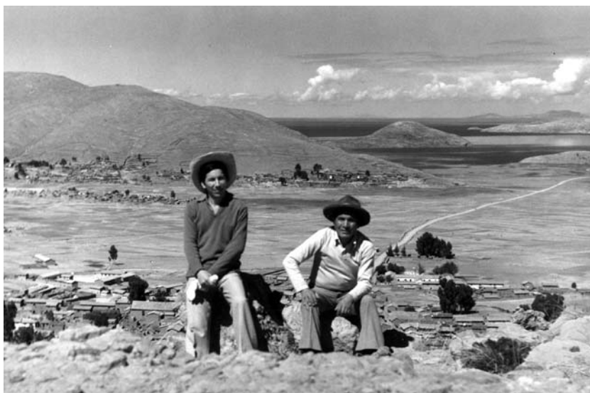
Vilquechico, Puno, 1984.