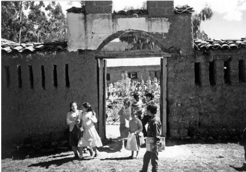
Portada del Núcleo Escolar Campesino de Ocobamba, escuela primaria donde estudió entre 1948 y 1957.