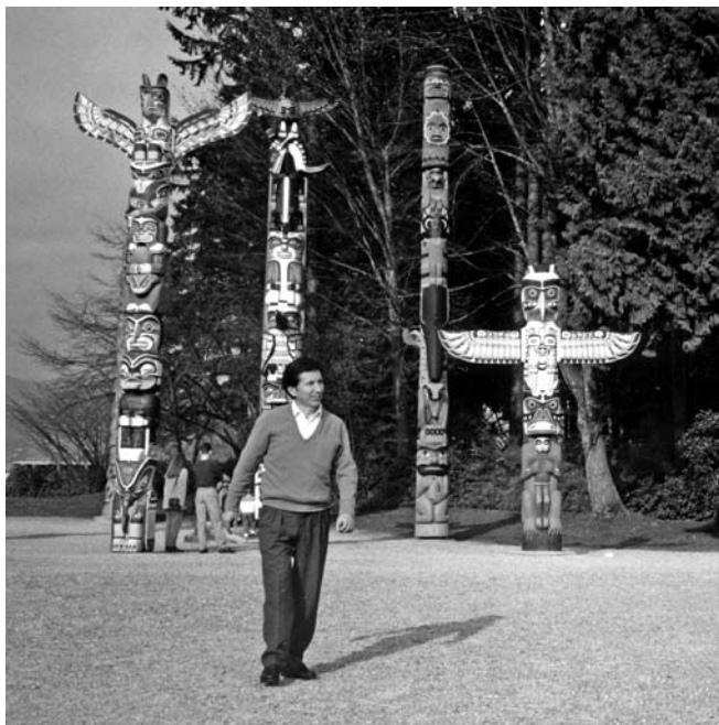
Tótems Kwakiult. Vancouver, 1996.