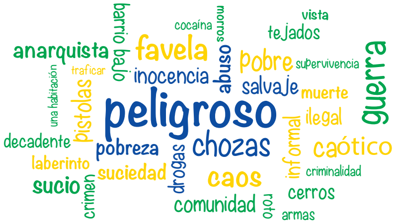
Figura 3 Percepciones de los turistas antes de visitar una favela

Elaboración de la autora en colaboración con Floor Schilling, usando Indesign.