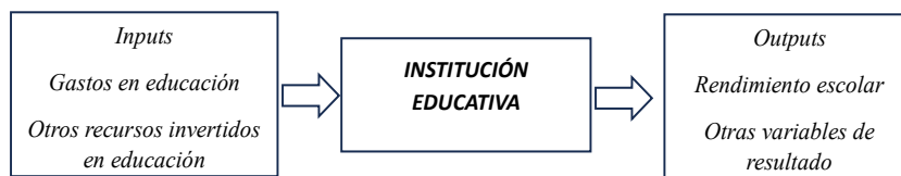
Figura 1. Proceso de producción de educación

Según la teoría microeconómica, es el productor quien maximiza los beneficios, minimizando