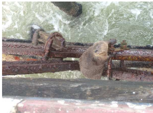
Figura 2. L. felina usando las estructuras del muelle artesanal de Huanchaco.

Durante las observaciones realizadas por los autores entre el 4 y el 6 de diciembre de 2009 se observó un (01) individuo moviéndose cerca del muelle artesanal (Figura 2). Durante los tres días de observación la nutria marina se refugió repetidamente debajo de la estructura del muelle, la cual presentaba restos de basura y desperdicios (Figura 3). En las entrevistas, cinco de los seis pescadores respondieron que han observado nutrias en Huanchaco alguna vez. Los mismos declararon haber visto solo un individuo sin que su presencia sea permanente a lo largo del año. Dos de aquellos pescadores detallaron que sus apariciones se limitan al verano. Cuatro de los seis pescadores entrevistados manifestaron su simpatía hacia las nutrias marinas, declarándolo un animal "bonito" al que no consideran un agente de