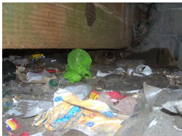
Figura 3. L. felina descansando bajo el muelle de Huanchaco, entre la basura.

competencia con su pesca. Es sabido que otra especie de mamífero marino, el lobo marino Otaria flavescens (Shaw, 1800), es visto como enemigo y fuerte competencia por los pescadores (Arias-Schreiber, 1993). Por otro lado, solo dos de los seis entrevistados sabían que la especie está protegida legalmente.