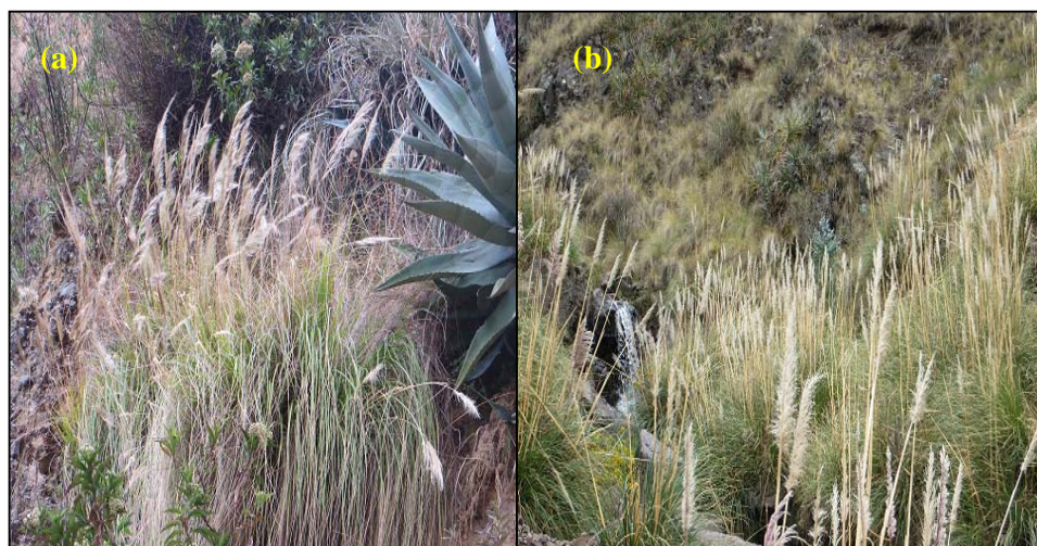
Figura 2. (a) Cortaderia hieronymi N.P. Barker & H. P. Linder, sector Llajuapampa. (b) Cortaderia jubata (Lemoine) Stapf, sector carretera a Carhuapata a 4.8 km de la capital del distrito de Lircay.