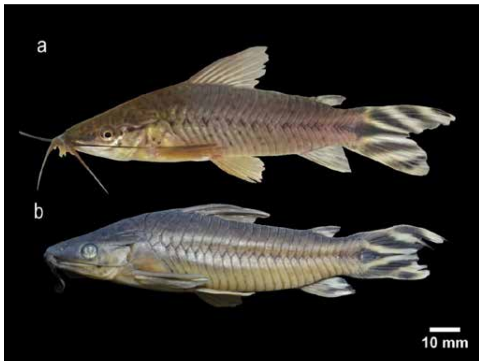
Figura 2. Dianema urostriatum , CLIAP 850, 98, 9 mm de longitud estándar, río Putumayo, Loreto, Perú. a) espécimen en vida, b) espécimen conservado.