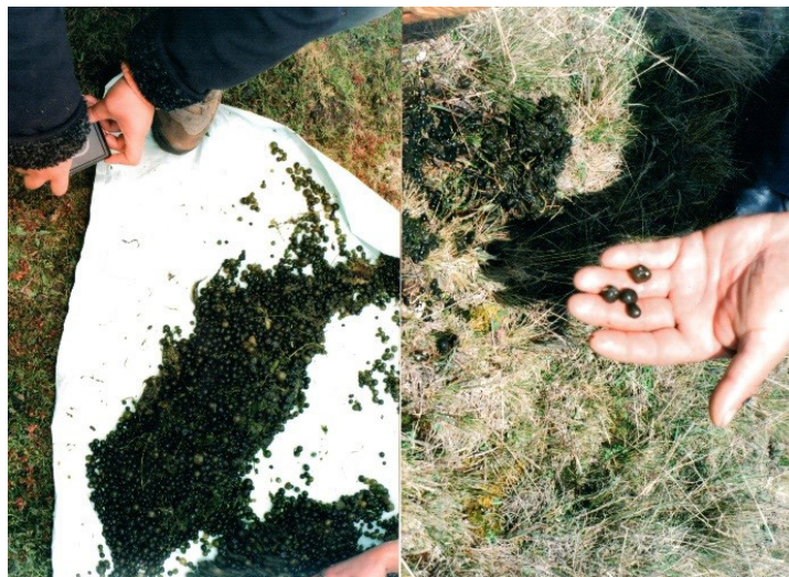
Figura 1. Recolección de Nostoc sphaericum en la laguna de Conococha, Huaraz, Perú

Se realizó un estudio analítico, experimental y longitudinal en el Centro de Investigación de Bioquímica y Nutrición (CIBN) de la Facultad de Medicina Humana de la Universidad de San Martín de Porres (FMH-USMP) y el Laboratorio de Farmacognosia de la Facultad de Farmacia y Bioquímica de la Universidad Nacional Mayor de San Marcos. El alga cianofícea Nostoc sphaericum fue colectada en la laguna Conococha en Chiquián (Huaraz) a 3400 m s. n. m. en el departamento de Ancash, Perú (Figura 1) y se depositó en el Museo de Historia Natural de la Universidad Nacional Mayor de San Marcos (Voucher USM 297250).