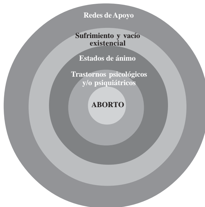
Figura 2: Onda expansiva del AE