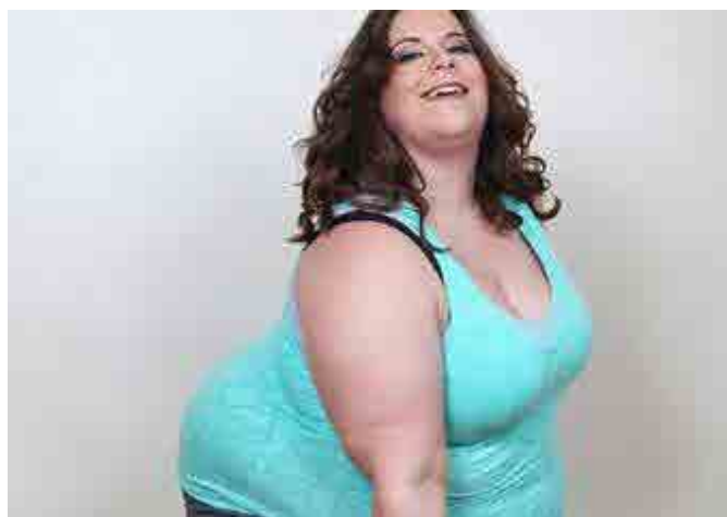
Figura 1. Imagen 1 del cuestionario

En la figura 1, presentamos la imagen 1 del cuestionario. Se pidió a los colaboradores que respondan ¿cómo es la mujer de la imagen?, y ¿qué está haciendo? El 61.9 % de atributos empleados corresponden al dominio del físico; mientras que el 7.14 % se refieren a la edad. Al respecto de lo físico, mujeres y varones emplearon los adjetivos gorda , gordita , obesa , blanca , de tez clara , guapa , bonita , vestida con ropa deportiva . Solo las mujeres la caracterizaron por la forma del cabello: de pelo corto , de cabello castaño . El rasgo del cabello para identificar la entidad solo es atendida o puesta en perfilamiento por las mujeres, debido a sus propias características físicas y sociales compartidas.