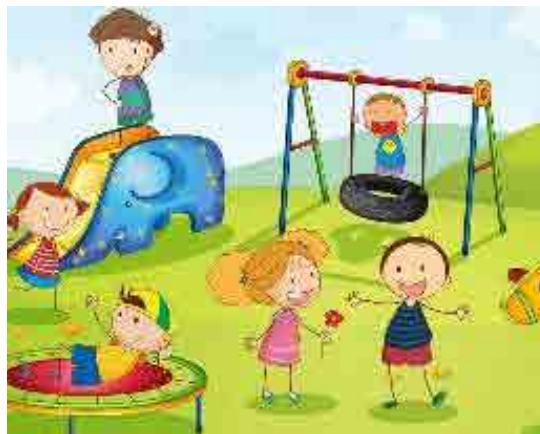
Figura 3. Imagen 5 del cuestionario