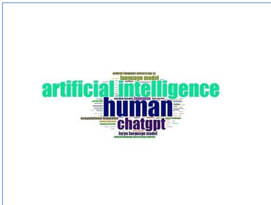
Figura 3. Nube de palabras. Campo: Keywords Plus; Número de palabras: 80; se removieron palabras sin significado para el tema (article, china, priority journal). Generado con Bibliometrix.