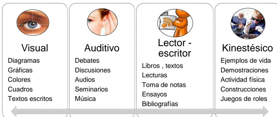
Figura 2. Actividades propuestas para cada estilo de aprendizaje VARK.

predilecciones de modalidad sensorial al momento de procesar información, al que denominan VARK: Visual, Auditivo, lector – escritor y kinestésico (García Nájera, 2007). Para Lozano (2004), el modelo VARK supone que cada estudiante puede identificar su propio estilo de aprendizaje, ser consciente de sus preferencias sensoriales (Sarmiento, Mayté, & Tuyub, 2017), adecuarse al estilo de enseñanza del docente y actuar sobre su propia modalidad, con tal de aumentar el aprovechamiento en su aprendizaje (Núñez, Hernández, Tomás, & Felipe, 2013). El modelo VARK proporciona una cuantificación de predilecciones de los estudiantes en cada una de los cuatro modos sensoriales (González, Alonso, & Rangel, 2012). En la Figura 2, se muestran actividades que pueden emplearse y que apoyarían cada estilo de aprendizaje.