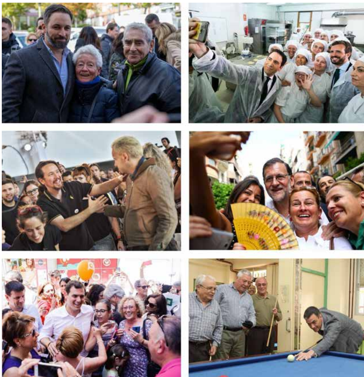
Imagen 1. Collage con imágenes protagonizadas por los candidatos, en actitud informal y acompañados por personas anónimas.