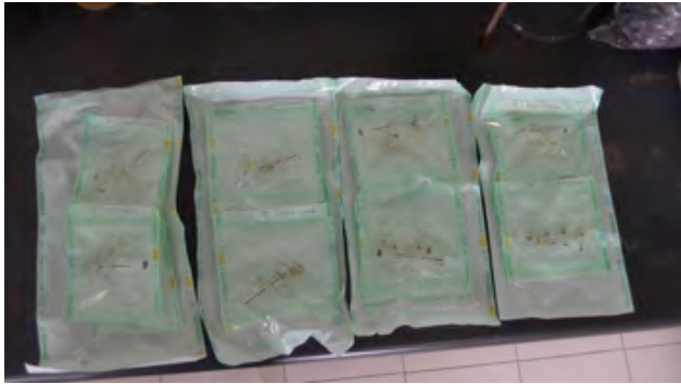
Figura 2. Esterilización en óxido de etileno por 13 horas.

El modelo de penetración bacteriana de cámara arriba y cámara abajo que se utilizó en este estudio fue descrito por Torabinejad y col. (6) en 1990. Se aplicó una doble capa de barniz de uñas (Maybelline) a los dientes previamente obturados con excepción de los últimos 3 mm apicales y se procedió a ensamblar las cámaras de cultivo utilizando dos tubos