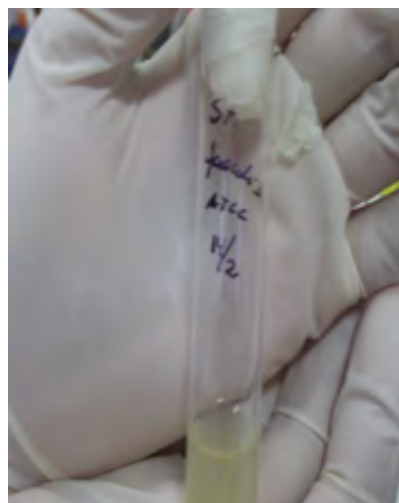
Figura 1. Activación de la cepa Enterococcus faecalis ATCC 29212.

Método de crecimiento.- La cepa de Enterococcus faecalis ATCC 29212 (bacteria anaerobia facultativa gram-positiva; procedente de una muestra proporcionada por el Laboratorio de Microbiología de la Universidad Peruana Cayetano Heredia), se activó llevando una azada de bacterias a un tubo de caldo infusión Cerebro Corazón-[BHI broth; (Oxoid, Hampshire, England)], a 37°C por 24 horas. Una vez confirmada su activación a través de la coloración de gram correspondiente se tomó 1 ml, es decir, una suspensión de células de aproximadamente 10^6 y se llevó a otro tubo de caldo BHI hasta una dilución 0.5 de Mc Farland (Figura. 1).