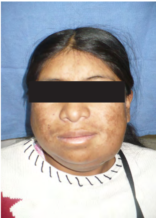
Figura 9. Control al 5to día postoperatorio, se observa aumento de volumen bilateral del edema inflamatorio postquirúrgico.

Los cortes axiales de la tomografía axial computarizada (TAC) muestran una imagen hiperdensa en cuerpo mandibular derecho con una dimensión de 6,04 cm x 6,90 cm de diámetro y otra localizada en cóndilo mandibular de 3,49 cm x 3,27 cm de diámetro.