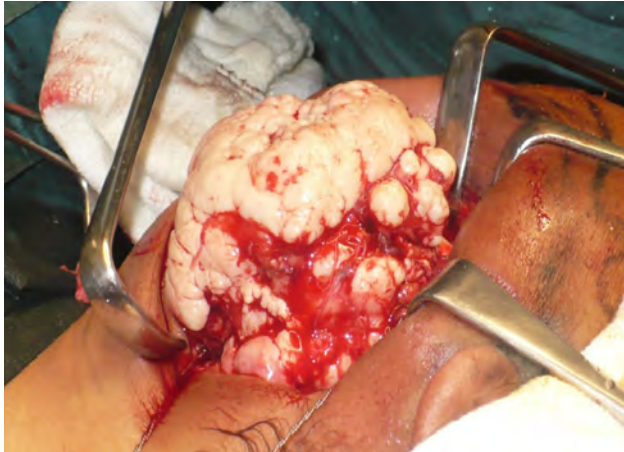
Figura 8. Remoción quirúrgica de masa tumoral, donde se visualiza la característica multilobulada de la lesión. Abordaje submandibular izquierdo.

región medial del cuerpo, ángulo y rama mandibular izquierda; en el lado derecho se visualiza lesión osteofítica que involucra cóndilo, apófisis coronoides y escotadura sigmoidea. Se aprecia otra lesión de menor tamaño en la parte media de ángulo mandibular (Figuras 6 y 7).