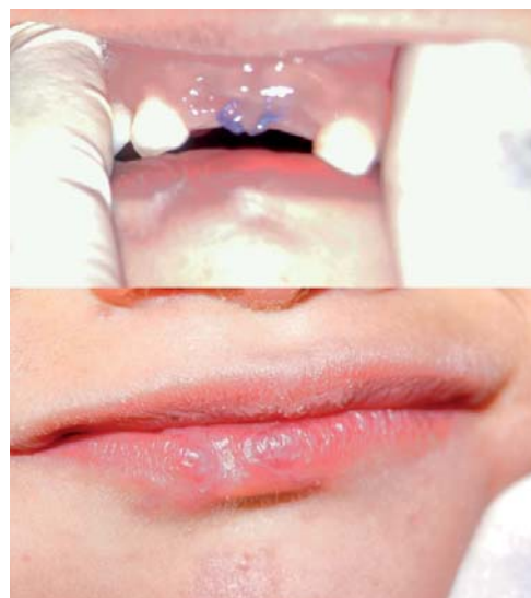
Figura 7. Paciente presenta franca mejoría en el proceso de cicatrización