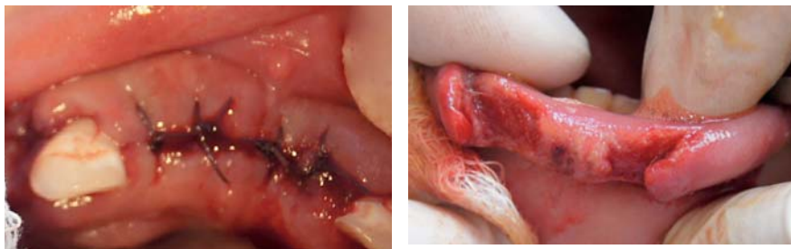
Figura 4. Odontectomía de OD 61