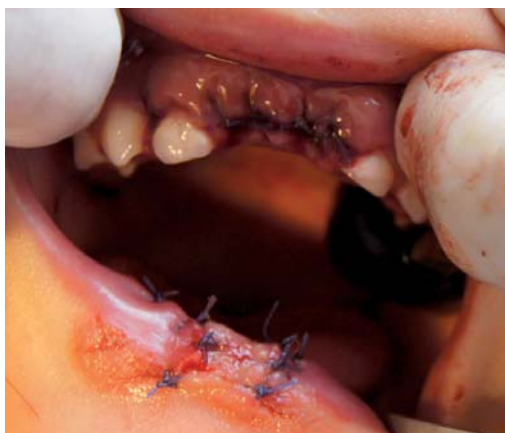
Figura 6. Cierre del labio por plano profundo utilizando vycril 3-0.