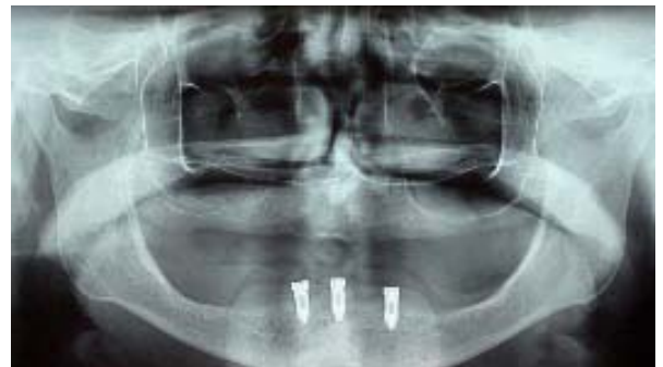
Figura 2. Rx panorâmico inicial.

região anterior foi constatado a presença de 3 implantes (Neodent®, Curitiba, PR, Brasil), plataforma de hexágono externo (HE), diâmetro de 4,1mm e 10mm de comprimento, que haviam sido instalados há 120 dias em um curso de especialização em implanto-dontia. No histórico cirúrgico levantado, todos os implantes apresentaram ótima estabilidade primária, com torque de inserção acima de 40Ncm, sem intercorrências também no pós-operatório. Os implantes, não apresentavam bolsas, sangramento a sondagem, qualquer grau mobilidade ou perda óssea significativa na radiografia panorâmica (Figura 2).