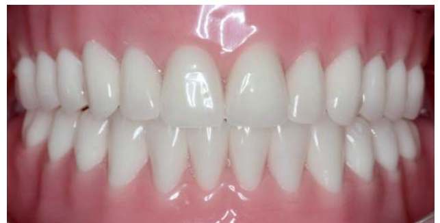
Figura 11. Próteses instaladas.