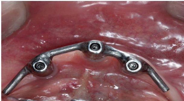
Figura 7. Prova do assentamento da barra metálica.

estrutura foi inserida passivamente em eixo único e sua perfeita adaptação foi constatada através de inspeção visual, sondagem das interfaces com sonda exploradora de ponta fina e por meio de radiografias interproximais. Juntamente, constatou-se a presença de espaço em relação ao rebordo que favorável a limpeza da região (Figuras 7 e 8).