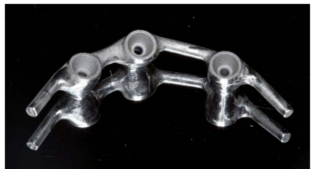
Figura 6. Barra metálica.