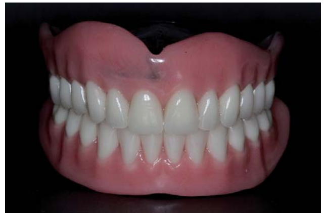
Figura 09. Peças protéticas acrilizadas.

No dia da entrega, aparafusou-se a barra metálica sobre os abutments com torque de 10Ncm, verificou-se o encaixa dos 03 clips plástico (Conexão®, São Paulo, SP Brasil) já contidos internamente na prótese inferior, bem como a retenção e estabilidade dela. A prótese superior foi assentada e aliviada na região de freio labial. Posteriormente a nova avaliação dos aspectos oclusais e estéticos, obtendo satisfação clínica em todos os itens, os orifícios dos parafusos foram selados com uso de uma fita de politetrafluoretileno (Tigre S/A®, Joinville, SC, Brasil) e resina composta fotopolimerizável (Brilliant New Line®, Rio de Janeiro, RJ, Brasil). A paciente recebeu instrução e treinamento de como colocar e retirar as peças protéticas, bem como realizar a adequada higienização delas, da barra metálica e de toda a cavidade oral. Além dessas instruções, a paciente teve um acompanhamento de uma fonoaudióloga. Concluído a entrega, a paciente demonstrou satisfação com os resultados estéticos e funcional obtidos (Figuras 9 a12).