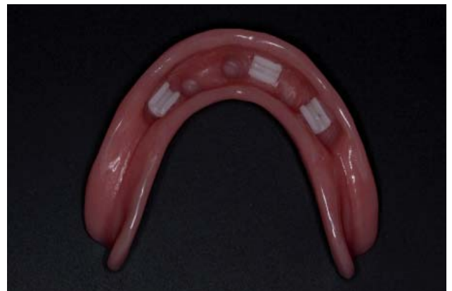
Figura 10. Vista interna da overdenture, com os 03 clips em posição.