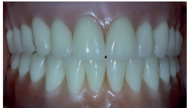
Figura 5. Prova dos dentes.

A fase subsequente objetivou provar o assentamento da barra metálica de cromo cobalto (Figura 6). A