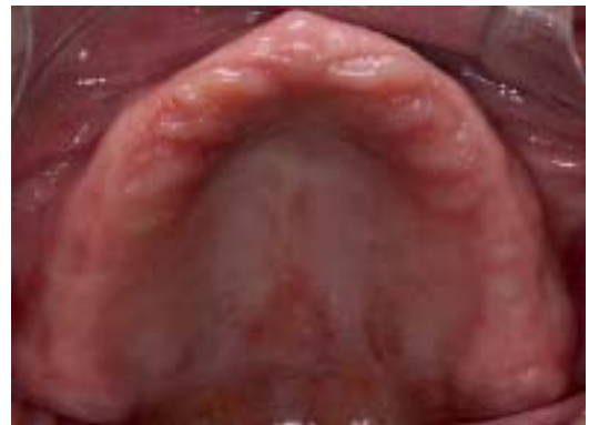
Figura 1. Arco Maxilar.

No arco mandibular, a paciente não fazia uso de qualquer prótese a alguns anos por alta instabilidade; na