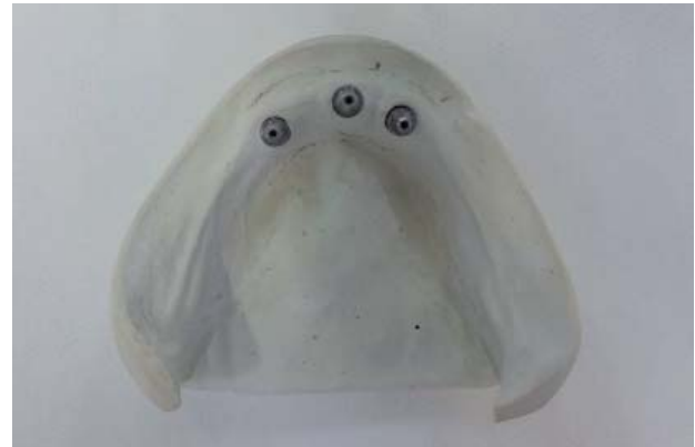
Figura 4. Molde de trabalho mandibular.

Na consulta seguinte foi executado o registro intermaxilar, estabelecendo uma nova dimensão vertical de oclusão (DVO), suporte labial, corredor bucal, plano oclusal, linhas alta do sorriso, média e das comis-