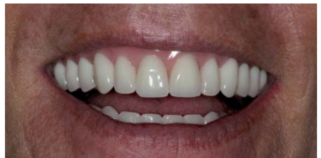
Figura 12. Sorriso final.