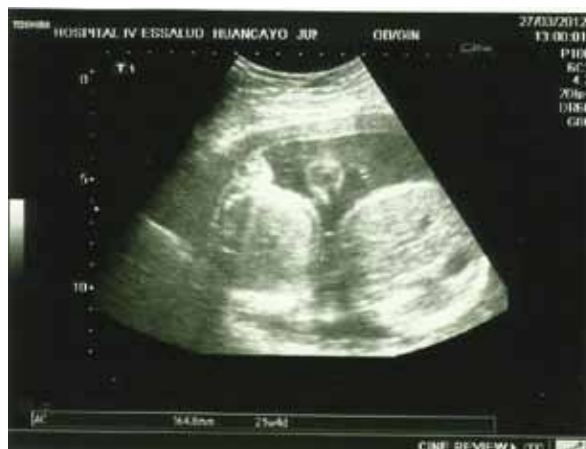
Figura 1. Hallazgo ecográfico de fetos discordantes, con circunferencias abdominales diferentes.

La edad gestacional al momento del diagnóstico fue 24 semanas, encontrándose los siguientes