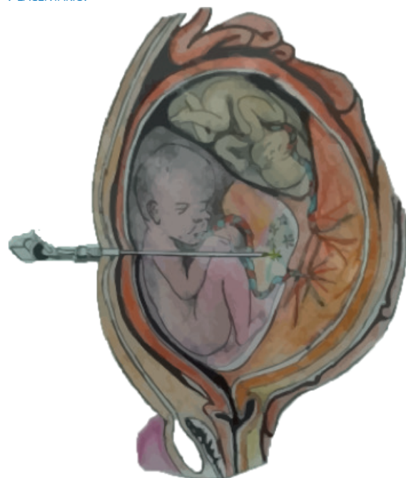
FIGURA 2. ESQUEMA QUE MUESTRA LA FULGURACIÓN DE LAS ANASTOMOSIS VASCULARES A NIVEL DEL ECUADOR PLACENTARIO.

El diagnóstico del STFF se basa en la evidencia ecográfica de un embarazo gemelar MCBA con la secuencia oligohidramnios/polihidramnios; el bolsillo máximo vertical es menor de 2 cm y ma-