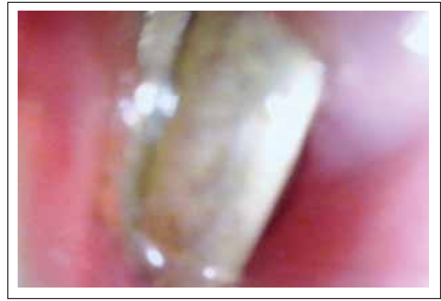
Figura 4. Video endoscopia que muestra dos monedas de 0,10 céntimos. Posteriormente se procedió a la extracción con pinza cocodrilo.