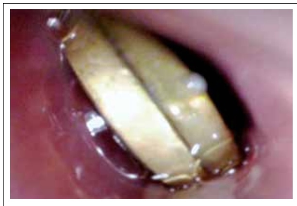
Figura 2. Durante la video endoscopia se evidencia la presencia de dos monedas de 0.10 céntimos adosadas entre sí.