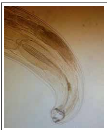
Figura 2. Larva de uncinaria.

La hemorragia digestiva se define como la expulsión de sangre por boca o por recto. La hemorragia digestiva alta se refiere al sangrado producido antes del ángulo de Treitz (1) , que puede manifestarse como hematemesis, melena o hematoquezia. La hemorragia digestiva de cualquier cuantía es un motivo de consulta frecuente en los servicios de urgencias pediátricos (2) .