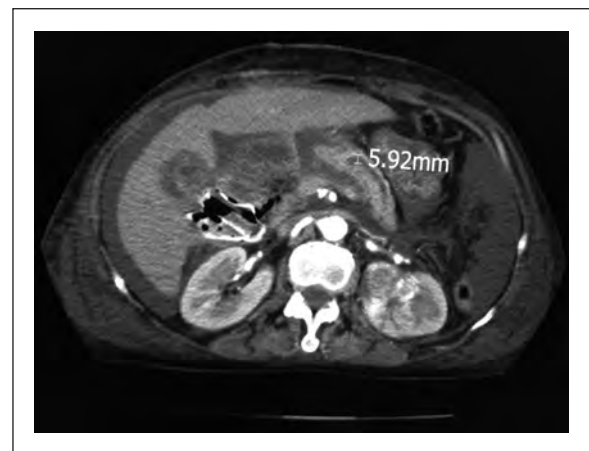
Figura 2. TEM abdomen muestra dilatación del Wirsung.

Los tumores periampulares tienen una presentación clínica muy similar entre ellos, con ictericia sin dolor,