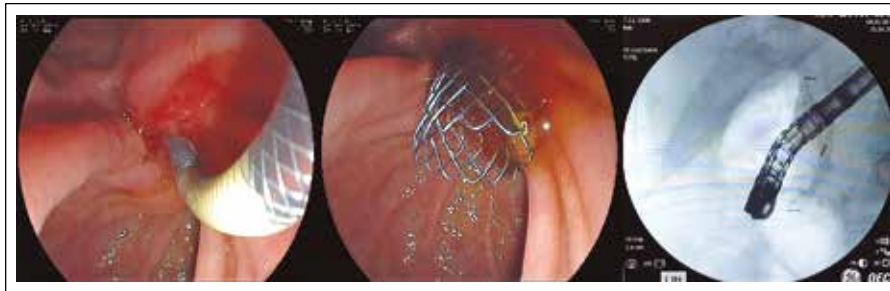
Figura 1. Colocación de SEMSnc de 10mm x 6cm en paciente con diagnóstico de ampuloma EC_IV.

SEMS: 1) BIL-stent, Endo-Flex, Voerde, Germany; 2) Zilver, Cook Endoscopy, Winston-Salem, North Carolina, USA; 3) Wallflex, Boston Scientific, Natick, Massachusetts, USA; y 4) Niti-S, Taewoong, Seoul, Korea. Los equipos usados para la colocación de las SEMS fueron el duodenoscopio ED-450XT5 y el videoprocesador EPX-4400 (FUJINON Co, Ltd, Tokyo, Japan).