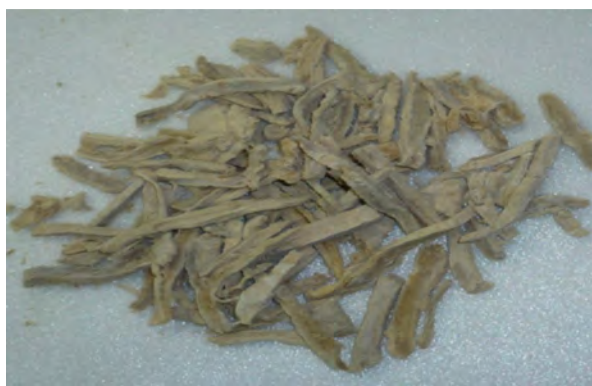
Figura 1: Charqui de alpaca deshilachado

tomaron muestras de charqui entero (con hueso) de distintos productores del distrito de Sicuani, provincia de Canchis, región Cusco (Figura 2), cuya temperatura promedio anual fluctúa entre los 10°C y los 13 °C, con una altitud de alrededor 3350msnm. Los análisis fueron realizados en los laboratorios del Área de Tecnología de los Alimentos de la Facultad de Veterinaria pertenecientes a la Universidad de León (España) y en el Laboratorio de Microbiología de los Alimentos, perteneciente a la Facultad de Industrias Alimentarias de la Universidad Nacional Agraria - La Molina (Perú).