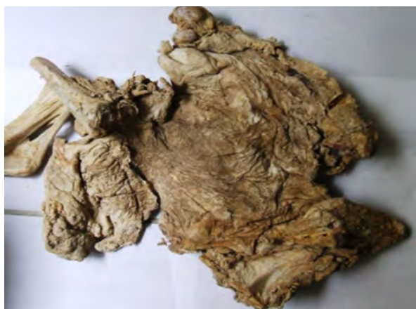
Figura 2: Charqui entero con hueso