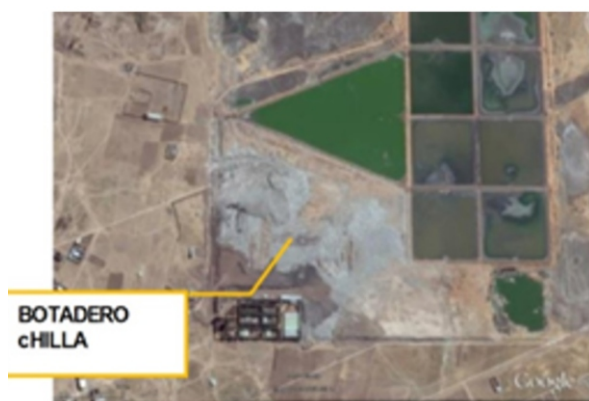
Figura 1 Plan de desarrollo urbano- Juliaca 2016-2025