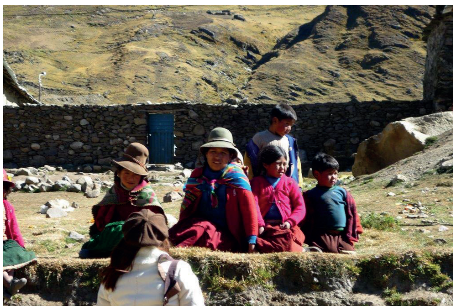
Figura 3. En las faldas de la montaña, una madre y su bebé, y cuatro niños pobladores de Quicho Azaroma.