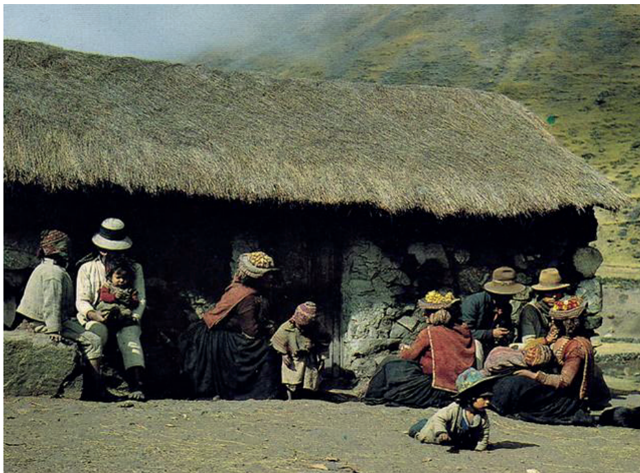
Figura 2. Ayllu Azaroma: la tierra de azachos, ganaderos y tejedores de estirpe histórico.

Desde aquí, como evidencia irrefutable de una fría realidad en tensión, sería pertinente despertar un modelo de Escuela-Montaña destinado a destruir la vitrina de los inmortales. La misma, que tenga la propiedad de reconocer los fallos y defectos del sistema con la furia de inducir e ir más allá de su radio de acción pedagógica agrupando sentimientos y emociones afectadas desde largas cordilleras continentales como los Alpes, los Himalayas y los Andes.