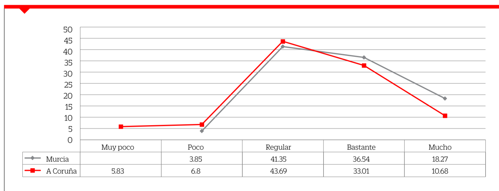
Figura 3. ¿Te sientes preparado para enfrentar tu próxima inserción laboral?

Por último, se persigue como tercer objetivo: considerar y evaluar la percepción que manifiesta el alumnado respecto de su preparación para enfrentarse al proceso de inserción socio-laboral en ambas universidades . Para ello, se tienen en cuenta las respuestas efectuadas por el alumnado ante la pregunta ¿te sientes preparado para enfrentar tu próxima inserción laboral? Los resultados permiten afirmar que, tanto en la muestra encuestada en la UM como en la UDC, expresa cierto grado de incertidumbre ante esa futura, y cada vez más cercana, inserción laboral que hace que alrededor del 40% del alumnado de ambas instituciones no se sienta certeramente preparado. Si bien, cabe decir que los valores positivos de la escala (bastante y mucho) aglutinan el 54.81% de las respuestas en el caso de la UM y el 43.7% en la UDC.