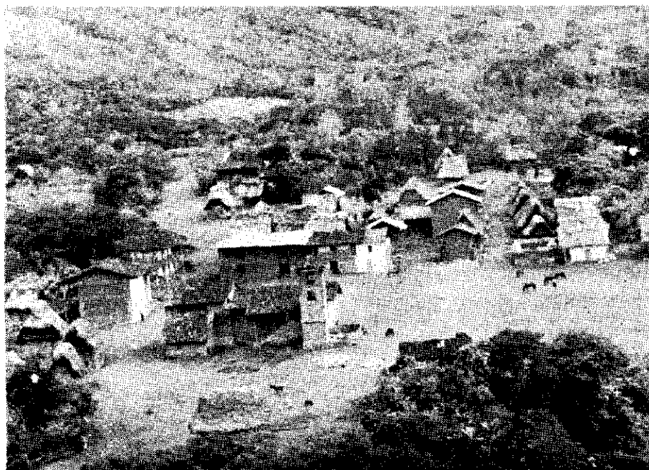
Fig. 1 —Vista parcial del pueblo de Omia, en la que se puede apreciar el tipo de construcción de las viviendas, propio de lugares cálidos como es la selva alta.