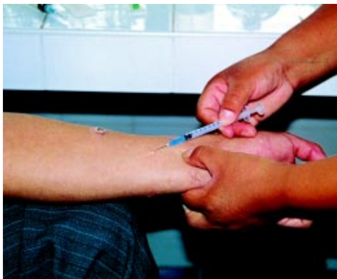
Figura 4. Aplicación de la leishmanina.