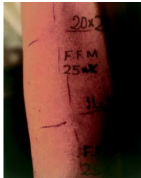
Figura 5. Reacción a las 48 horas post-aplicación.

Los resultados de los conformantes de este grupo, evaluados en la localidad andina de Colasay, indican que 14/15 (93,3%) fueron sensibles a la prueba intradérmica. Un individuo con leishmaniasis curada de procedencia selvática, que acudió al INS para control serológico, no respondió a ningún antígeno (Tabla 4).