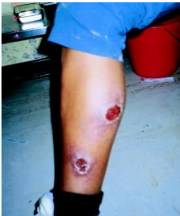
Figura 2. Lesiones cutáneas.