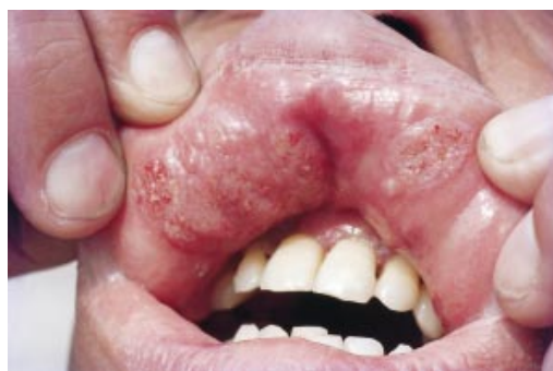
Figura N° 2. Característico granuloma moriforme microhemorrágico secretante doloroso.