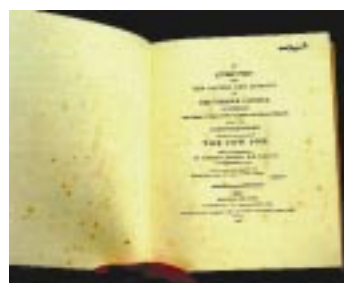
Figura N° 8. Página frontal de uno de los más famosos libros de la historia médica. Tiene 75 páginas, con 4 ilustraciones en color y está escrito en un lenguaje sobrio y conciso.

"En la presente era de la investigación científica, hay que resaltar la existencia de una enfermedad de tan peculiar característica como lo es la "Vacuna", que ha aparecido en algunas vecindades desde hace algunos años. Este hecho no debe pasar desapercibido... he instituido una rigurosa investigación sobre las causas y efectos de esta singular enfermedad..."