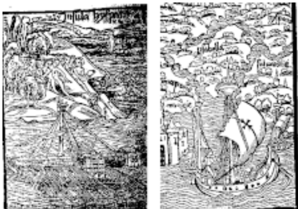
Figura N° 1. Cristóbal Colón, en 1493, presentó un informe a los Reyes Católicos sobre su viaje y descubrimiento, dicho informe estuvo ilustrado con grabados alusivos 3 ; además, de un relato muy expresivo sobre lo que encontró y las características de los nativos. Ojalá esto hubiese servido de ejemplo para los mudos y ciegos cronistas de la conquista del Imperio de los Incas. A su regreso, Colón, en el segundo viaje, no encontró ningún nativo, en la isla bautizada por él como "Juana". Todos habían muerto por diversas plagas, no especificadas. (Tomada de: "Carta de Cristóbal Colón en que da cuenta del descubrimiento de América al señor Almirante Rafael Sánchez, Tesorero de los Serenísimos Monarcas, 4 de marzo de 1493". Edición facsimilar del texto latino con traducción castellana. México, 1939)

Las enfermedades virales epidémicas que por milenios azotaron a las poblaciones de Asia, Europa y África fueron trasplantadas a las poblaciones nativas del Nuevo Continente. Viruela, sarampión y gripe fueron enfermedades desconocidas por los sistemas inmunitarios de los amerindios; en cambio los invasores, como ocurre con todas las enfermedades endémicas (con brotes epidémicos), las habían padecido en la infancia; por eso mismo, los primeros europeos que arribaron al nuevo continente eran sobrevivientes de esas plagas. Por consiguiente, a la hora del "intercambio", los invasores estaban inmunizados; mientras que los invadidos fueron presa fácil de las formas más graves de esos males, sin distinción de sexo o edad.