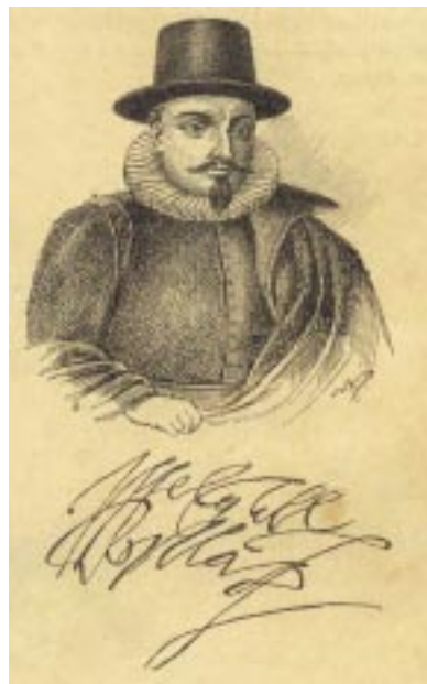
Figura N° 5. Retrato de don Francisco Torres y Portugal, Conde de Villar don Pardo, 7° Virrey del Perú (Desde 1584 hasta 1590), durante la etapa de consolidación política de España en el territorio andino y también, de la permanencia de las epidemias traídas por los conquistadores. Es el único que se preocupó por la salud de los nativos, en el siglo XVI. Su actuación merece ser mencionada en toda historia de las epidemias del Perú y la región Andina (Tomado de Ricardo Palma: Tradiciones Peruanas. Tomo I. Montaner y Simón, Barcelona, 1893. p. 171).

El único que demostró preocupación fue el séptimo virrey don Fernando Torres y Portugal, Conde Villar-don-Pardo 15 (Figura N°5), quien en cartas y otros documentos dejó testimonio de su interés por la salud de los nativos así como de procurar medidas que pudiesen paliar las lamentables consecuencias de las enfermedades.