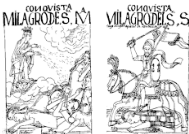
Figura N°4. Elocuentes gráficos realizados a pluma por el cronista indio Huamán Poma de Ayala donde ilustra las patrañas que los conquistadores elaboraron durante el sitio del Cusco, para hacer creer a los nativos que la viruela era castigo de Dios. (Tomado de Huamán Poma de Ayala F. Nueva Crónica y Buen Gobierno. Escrita en 1587 como una carta dirigida por el autor al Rey Felipe II. Copia facsimilar en: Codex péruvien illustré) Institut D'Ethnologie, Paris, 1936. p. 402-4.

Los nativos, con Manco II a la cabeza, se dieron cuenta de que los arcabuces y los primitivos cañones hacían más ruido que daño, matando a lo mucho a uno o dos soldados a la vez y que pasaban muchos minutos antes que disparasen nuevamente; que los caballos no eran sino animales de carne hueso y, por último, que los conquistadores no eran otra cosa que una partida de bastardos. Pero, lo que Manco II no supo, en esos tiempos nadie lo sabía, es que al reunir una gran cantidad de jóvenes combatientes creó las condiciones para la expansión de enfermedades propagadas por contagio de persona a persona, como lo eran las tres apocalípticas plagas. Es por eso que los soldados incaicos, durante el sitio, fueron diezmadados por esas enfermedades mortales.