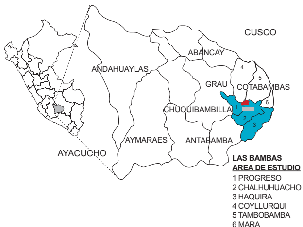
Figura 1. Mapa de provincia de Apurímac donde se desarrolla el Proyecto Minero Las Bambas 2006.

Estudio descriptivo de corte transversal realizado en el año 2006 en tres distritos de la región Apurímac: Haquira, Chalhuhhuacho y Progreso (Figura 1), que se encuentran en el área de influencia del proyecto minero Las Bambas.