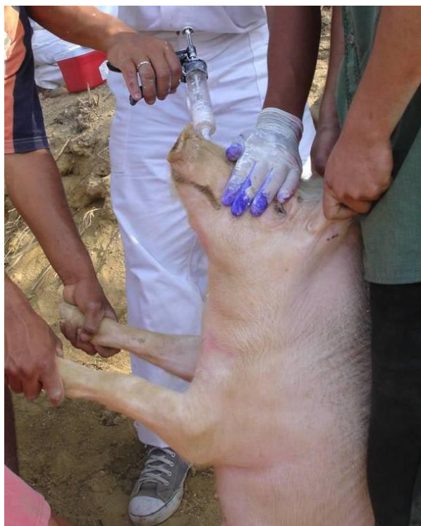
Figura 3. Administración de oxfendazole a un cerdo en el marco de un programa de control en el campo.

En la población porcina se usaron dosis orales de 30 mg/kg de oxfendazole. Esta droga se administró a todos los cerdos mayores de dos meses, presentes en las comunidades al tiempo de cada ronda de intervención (Figura 3). Adicionalmente, en colaboración con la Universidad de Melbourne en Australia, pudimos contar con la efectiva vacuna TSOL18 para la cisticercosis porcina. Esta vacuna, de eficacia cercana al 100%, se administró a todos los cerdos mayores de dos años, en dos dosis separadas por dos semanas.