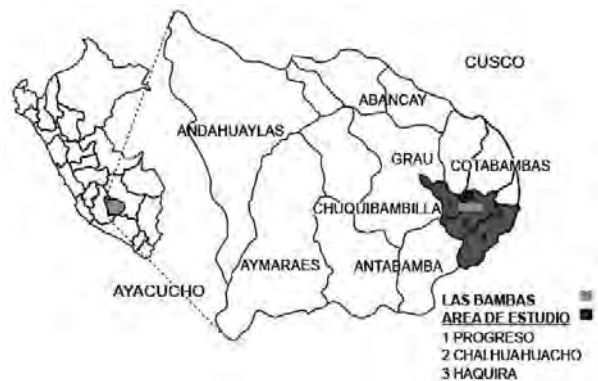
Figura 1. Mapa de la provincia de Apurímac donde se desarrolla el proyecto minero Las Bambas

Se realizó un estudio descriptivo de corte longitudinal en la población de tres distritos de la región Apurímac: Challhuahuacho, Progreso y Haquira, que residen en el área de influencia social del proyecto Las Bambas, para determinar los niveles de plomo, cadmio, arsénico