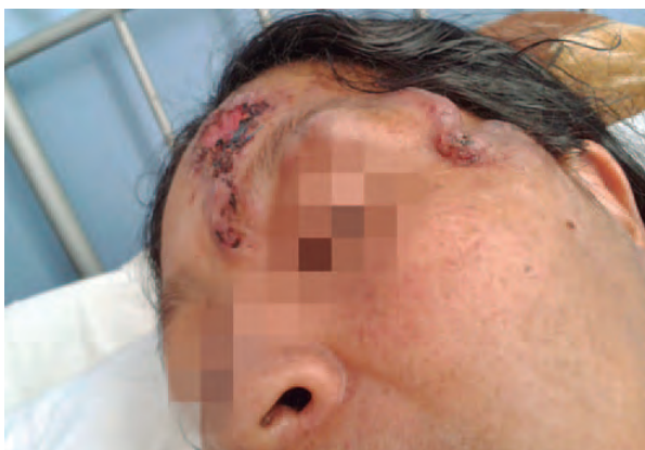
Figura 1. Úlcera facial y múltiples nódulos subcutáneos en la región palpebral y preauricular izquierdas

En el examen clínico se encontró una úlcera de aproximadamente 4 cm de diámetro en la región frontal