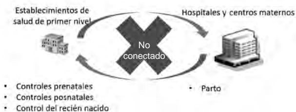
Figura 3. Flujo de información entre los establecimientos de salud de primer nivel y los hospitales y centros maternos.

Cuarto, la capacidad en el manejo de los datos por parte del personal de estadística en los establecimientos a nivel local, intermedio y nivel central es limitada. En la microrred, los datos son consolidados y elevados al nivel superior con fines de monitoreo, gestión y planificación de los servicios