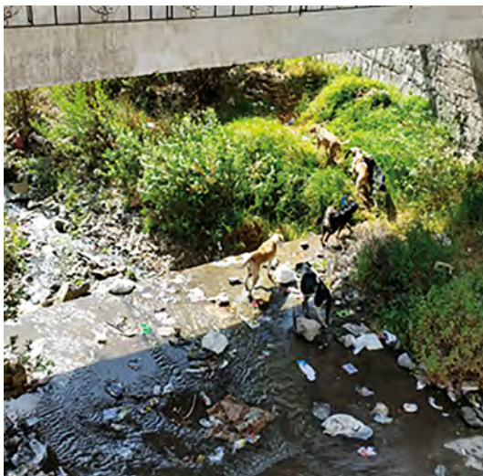
Figura 2. Perros vagabundos desplazándose a lo largo de una torrentera o canal de agua.

Mediante una revisión sistemática sobre campañas de vacunación antirrábica en perros, Davlin y Vonville concluyeron que se necesitan estudios sobre ecología canina en áreas afectadas por el VR (45) . En esa línea, Wandeler et al. (47) estimaron que un perro vagabundo en zonas urbanas puede tener un ámbito hogareño de hasta 8,5 km. En Arequipa, recientemente se ha planeado realizar vigilancia epidemiológica y control de la población canina en los canales de agua que surcan la ciudad, más conocidos como torrenteras (Figura 2) y en los botaderos informales (48) . Esto reconoce, en parte, la heterogeneidad espacial producida por las estructuras urbanas y por la distribución espacial de los recursos que las jaurías utilizan. La mayor probabilidad de observar jaurías en las torrenteras o en los botaderos es solo un ejemplo de cómo la ecología canina se entremezcla con