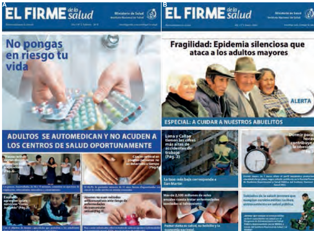
Figura 3. Portadas del periódico mensual «El Firme de la salud» A) Número 2 mes de febrero 2018, B) Número 1 mes de enero 2018.

Es una publicación mensual que tiene como lema «Democratizando la ciencia», su objetivo es presentar aquellas publicaciones científicas de la Revista Peruana de Medicina Experimental y Salud Pública (RPMESP) seleccionadas por: a) importancia en la salud pública nacional, b) posibilidad de impacto como noticia, c) actualidad de tema tratado y d) contener información de aplicación en la población peruana. También incluye publicaciones científicas seleccionadas de revistas científicas internacionales que cumplan con los criterios anteriores. El periódico es distribuido en formato impreso, y en formato digital a través del portal web del INS. (Figura 3).