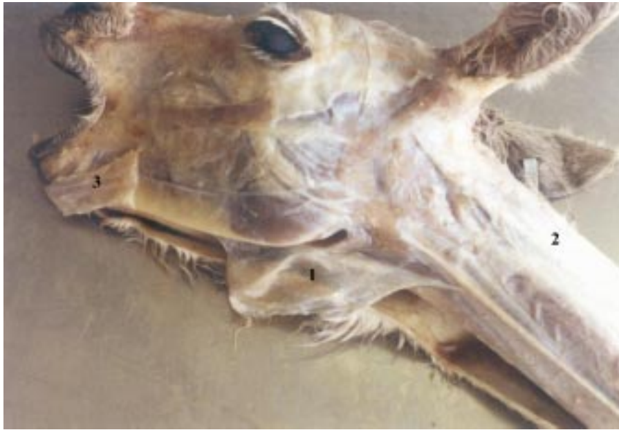
Figura 1. 1. Fascia superficial y músculo cutáneo (reflejado); 2. Aponeurosis dorsal común al músculo braquiocefálico y músculo trapecio; 3. Músculo platysma (reflejado)