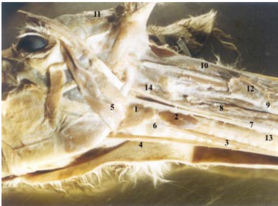
Figura 4. 1. Músculo Laríngeos; 2. Glándula tiroides; 3. Músculo esternotiroideo; 4. Músculo esternohioideo; 5. Músculo esternohioideo (reflejado); 6. Músculo cricotiroideo; 7. Tendón del músculo esternocefálico; 8. Músculos intertransversos ventrales; 9. Músculos intertransversos dorsales; 10. Músculos complejos; 11. Músculo interescutular; 12. Músculo omohioideo (reflejado y seccionado); 13. Traquea; 14. Músculo largo ventral mayor y menor de la cabeza (algunas fibras)