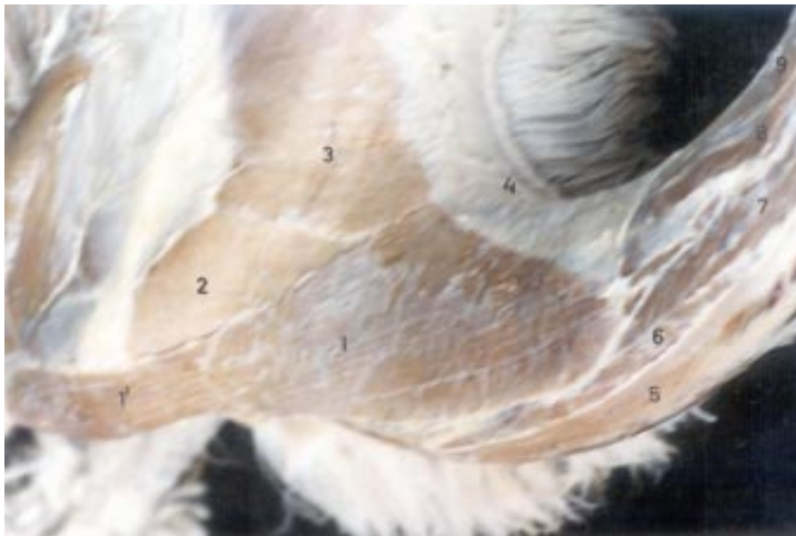
Figura 2. 1. Músculo braquiocefálico, porción cleidocervical; 1. Músculo braquiocefálico, porción cleidobraquial; 2. Músculo omotransverso; 3. Músculo trapecio; 4. fascia dorsal; 5. Músculo esternocéfálico + esternohioideo; 6. Músculo intertransversos ventrales; 7. Músculo intertransversos dorsales; 8. Músculo semiespinal; 9. Ligamento nucal

estructura del músculo. En el extremo proximal y sobre el dorso del cuello se encuentra una porción aponeurótica que se mezcla con la aponeurosis del músculo trapecio cervical y del omotransverso, para luego dirigirse hacia el tercio craneal, que le sirve de inserción. Se ha encontrado una