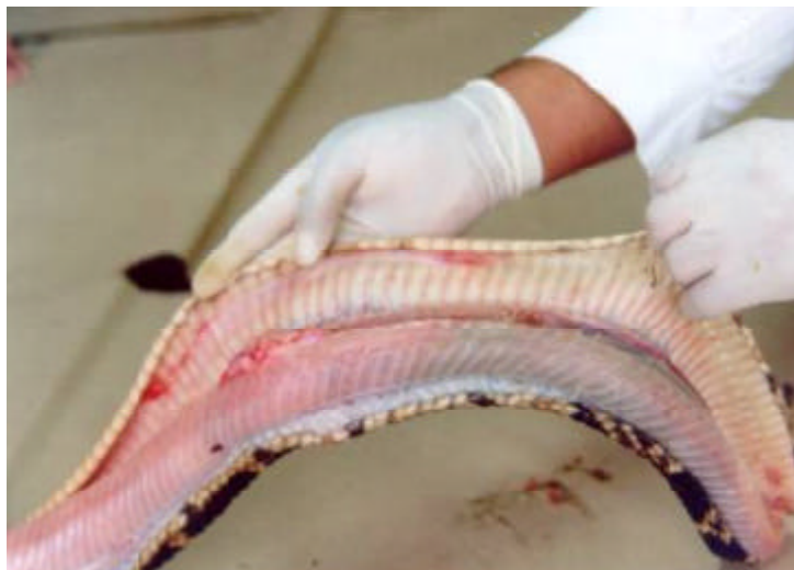
Figura 1. Necropsia y extracción de cuatro pentastómidos de la cavidad corporal y serosa pulmonar de Lachesis muta .

A un ejemplar hembra de la serpiente Lachesis muta , de 1.95 m de longitud y con edad aproximada de 9 años, proveniente de Satipo, Junín, que estuvo en cautiverio en el serpentario del Museo de Historia Natural