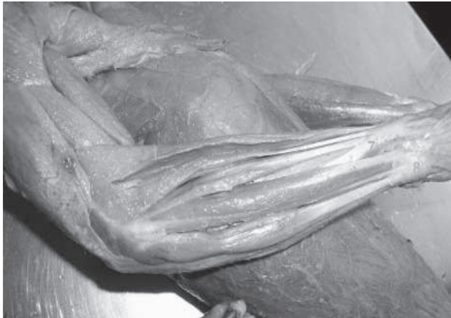
Figura 1. Músculos superficiales de la cara lateral de antebrazo del mono Cebus albifrons . 1: m. braquioradial, 2: m. extensor carpo radial largo, 3: m. extensor carpo radial corto, 4: m. extensor digital común, 5: m. extensor digital lateral, 6: m. extensor carpo cubital, 7: m. abductor largo del pulgar, 8: ligamento transverso dorsal del carpo