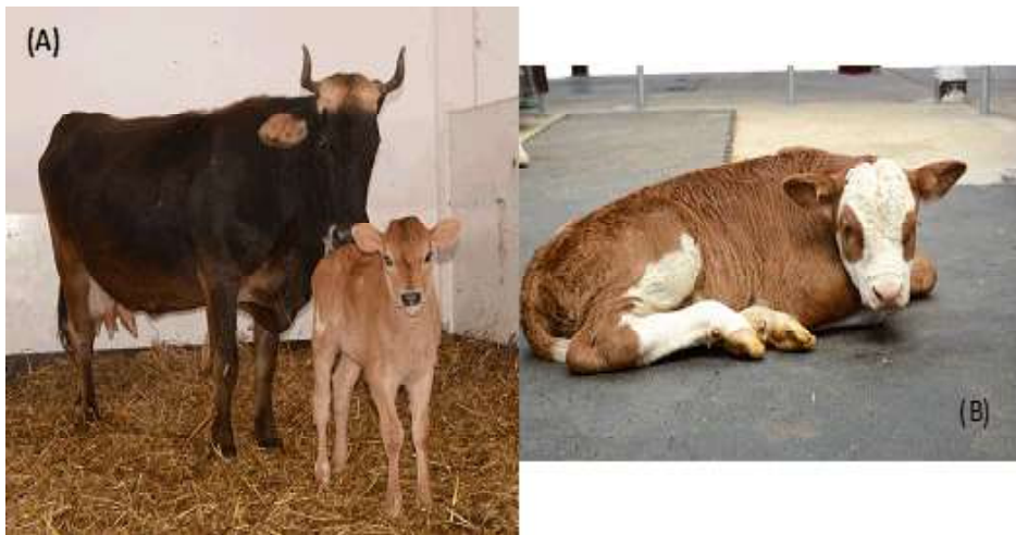
Figura 2. Los terneros clonados mediante la técnica mediante transferencia nuclear de células somáticas (SCNT). A: Tenera Jersey Alma-C1, en el día del nacimiento. B) Ternera Simmental Altagracia-C1

de la línea celular durante las rutinas de trabajo con las células (cultivo in vitro , congelación y descongelación), ni por el pulso eléctrico durante la fusión. Estos resultados coinciden con el trabajo de Hayes et al. (2005). Daños considerables en las membranas como producto de la congelación se reflejan en una disminución significativa en los porcentajes de fusión (34.2 vs. 13.1%). Los porcentajes de fusión obtenidos (65.8 vs. 86.9%) de las dos líneas celulares fueron superiores a los reportados para la técnica de clonación con micromanipuladores, independientemente de las células donantes (Hayes et al. , 2005) y similares a los reportados para HMC en bovinos (Vajta et al. , 2003).