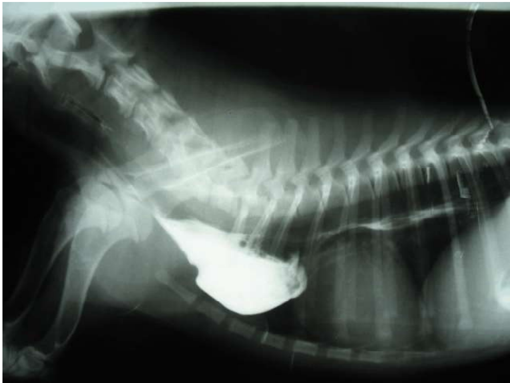
Figura 1. Tórax, vista laterolateral derecha, mostrando la presencia del megaesófago pre-cardíaco y el escaso pasaje de medio de contraste

van Gundy 1989; Holt et al. 2000). La evaluación preoperatoria, especialmente la angiografía, mejora la planificación del abordaje quirúrgico y la identificación de estructuras que requieren ligadura y división. El amplio conocimiento de la anatomía vascular facilita la identificación intraoperatoria precisa de la naturaleza del anillo vascular, particularmente en casos de configuraciones raras e inusuales (House et al. , 2005).