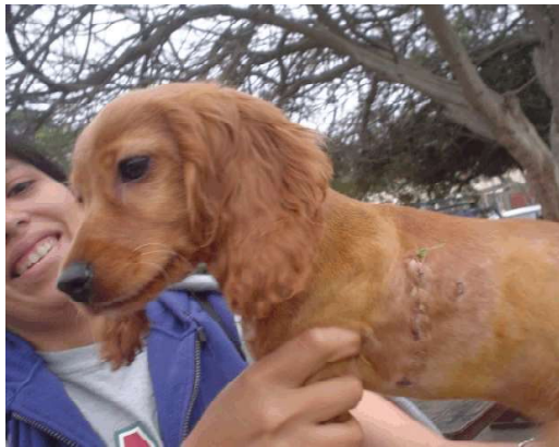
Figura 4. Paciente después de 10 días de la cirugía correctiva del cuarto arco aórtico persistente

Finalmente se procedió a la colocación de un tubo de toracotomía utilizando una sonda de Foley siliconada y se realizó el cierre de la pared torácica mediante el afrontamiento intercostal con suturas de nylon y la síntesis de los planos musculares en el orden inverso a lo realizado en el ingreso. Una vez terminada la sutura de los tejidos blandos, se acopló una llave de tres vías a la sonda de Foley para sellarla y devolverle la negatividad de la cavidad torácica. La sonda permaneció en su posición por dos días, protegida por un vendaje simple, y luego fue retirada por tracción simple. Terminado el abordaje se infiltró una solución de lidocaína 2% con epinefrina desde el 2° al 6° espacio intercostal a fin de mejorar la analgesia posoperatoria temprana. La analgesia posoperatoria se manejó con morfina, vía endovenosa, a las 2 h de terminada la cirugía y se mantuvo con tramadol cada 12 h por 4 días. La terapia antibiótica se realizó con cefalexina 25 mg/kg, vía oral, cada 8 h por 7 días. La sutura de la piel fue retirada a los 10 días. En la Figura 4 se puede observar al paciente 10 días después de la cirugía, en estado normal.